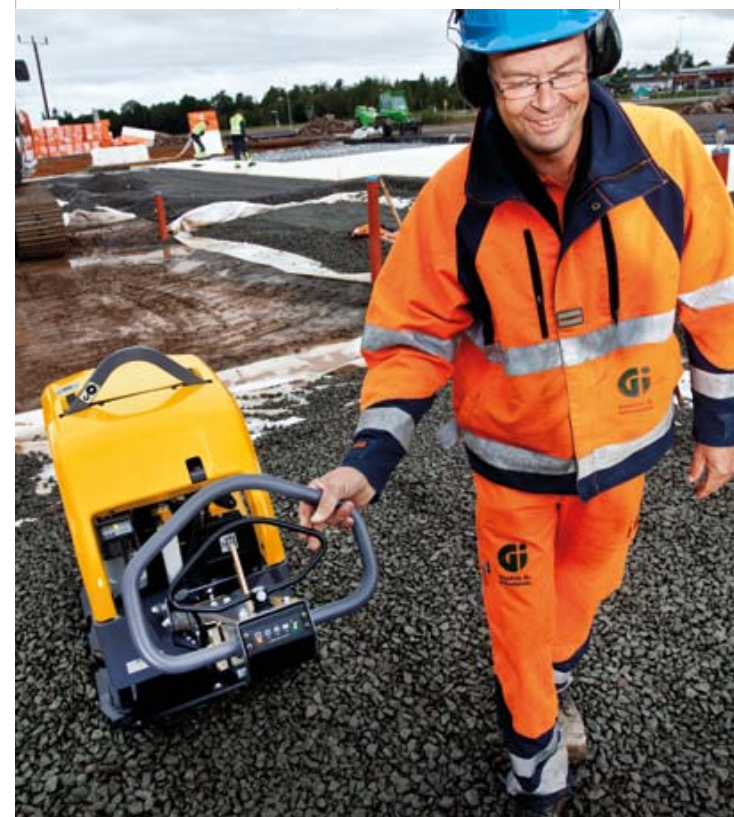
Удобное изменение направления хода с помощью клапана управления гидравлической системой.

В качестве опции модель LG400 может быть оснащена дополнительным средством сокращения эксплуатационных затрат – индикатором, наглядно отображающим степень уплотнения поверхности. Исключив чрезмерное уплотнение, можно не только повысить производительность и улучшить результат работ, но и избежать чрезмерного износа оборудования.